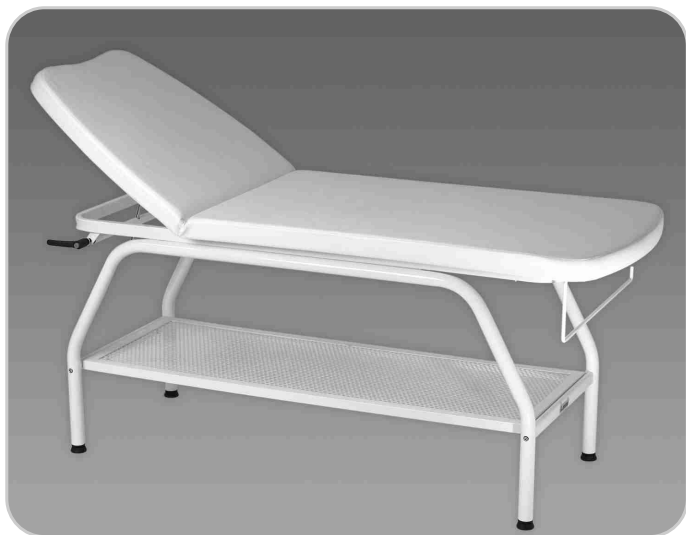
Cod.001 Versione standard senza foro Standard version without face hole

Face and body treatments, soft massages, depilation, pressotherapy, diagnostics, dermatology, aesthetic surgery.